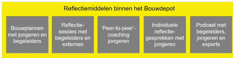
Figuur 2. Bouwdepot-activiteiten vanuit het ontwerpteam.

Weer een ander middel om de reflectie rondom het Bouwdepot te vergroten was de podcast. Daarin hadden niet alleen de jongeren een centrale plek, maar ook diverse experts vanuit het veld van de maatschappelijke opvang. De meeste respondenten vinden de podcast een waardevol reflectiemiddel voor de jongeren dat hen in staat stelt om (samen) terug te kijken op hun ontwikkeling en de (niet)behaalde resultaten. Tevens leverde de podcast input op voor begeleiders om in gesprek te gaan met de jongeren. Ten slotte zijn ook individuele en groepssessies georganiseerd met de jongeren en de begeleiders waarin zowel werd gereflecteerd op de ontwikkeling van de jongeren als op de voortgang van het Bouwdepot als geheel. Met de mix aan reflectiemiddelen kan ingespeeld worden op de behoeften en context van zowel de jongeren als de begeleiders. Dit verdient verdere navolging in een doorontwikkeling van het Bouwdepot.