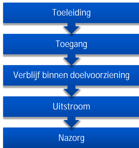
Figuur 1: Stappen in de keten

Volgens de huidige structuur begint de keten dak- en thuisloze jongeren bij het veldwerk en eindigt bij de uitstroom. Het aanbod binnen de keten is verschillend; 24-uurs intramurale voorzieningen, begeleid wonen, Housing First, groepswoningen voor jongeren met een LVB-problematiek en woonvormen voor de jongeren die nog naar school; de zogenaamde WLW-trajecten. Hoewel de hulpvragen van deze jongeren ook complex kunnen zijn, zijn zij vaker perspectiefvoller in hun zelfredzaamheid en kunnen met lichte begeleiding en met ondersteuning vanuit de peergroep een zelfstandiger leven leiden binnen de keten. Na de uitstroom bieden de ketenpartners nazorg. De nazorg duurt drie maanden tot een jaar.